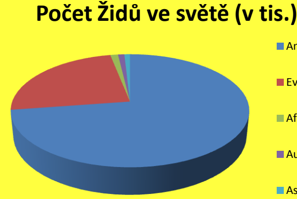
Zdroj: Šlachta, M. a kol., 2007, s. 72.