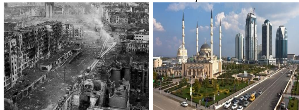
Obr. 2: Proměna hlavního města Grozny

Zdroj: http://www.czech.ruvr.ru , http://www.democraticunderground.com/