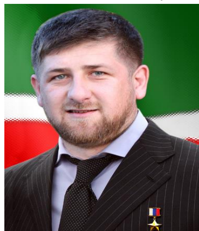
Obr. 1: Ramzan Kadyrov