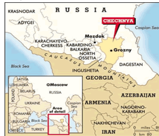
Mapa 1: Oblast Kavkazska