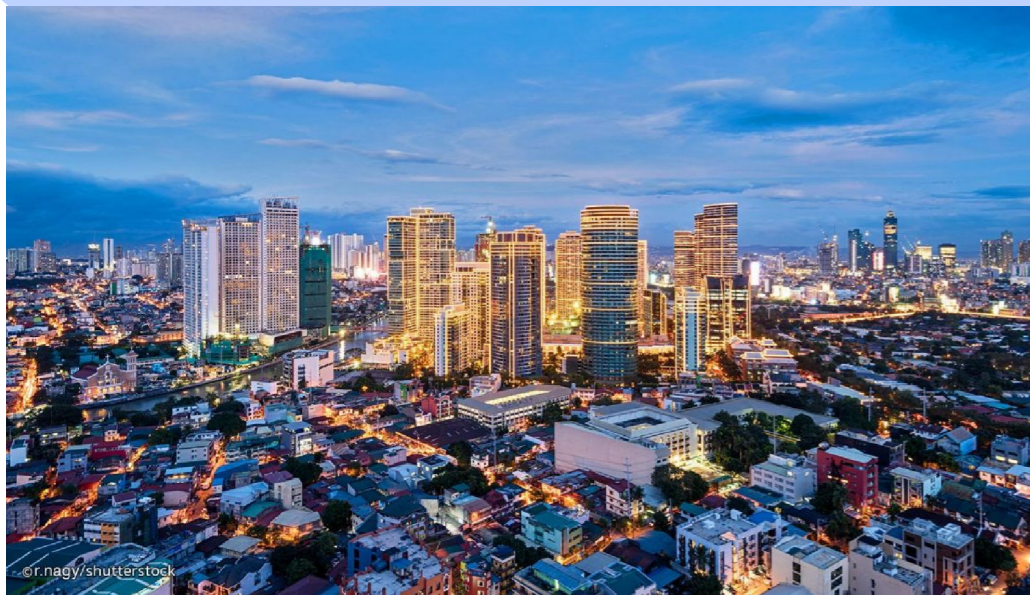
centrum hlavního města Manily

Filipíny jsou zejména od druhé poloviny 20. století velmi rychle se rozvíjející ekonomikou jihovýchodní Asie. Ne nadarmo jsou řazeny do druhé vlny "asijských tygrů". Tento přídomek však získaly primárně na základě dynamického rozvoje centrální části Luzonu v metropolitní oblasti Manily.