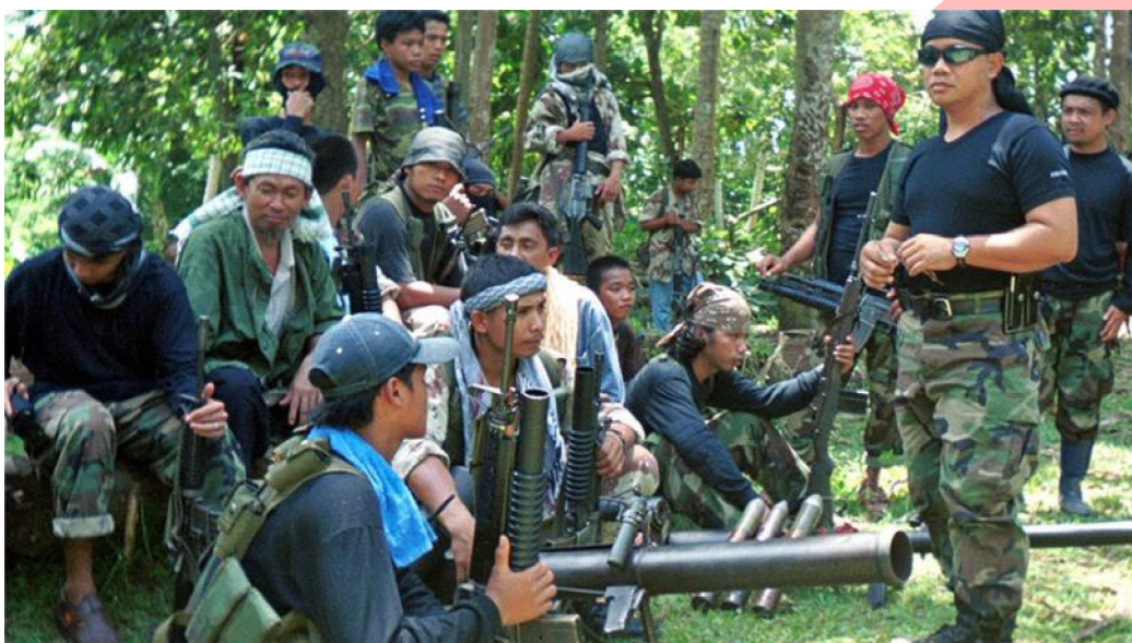
milice teroristické organizace Abú Sajjáfa, zdroj: Informativa

jižní Mindanao a souostroví Sulu praktiky inspirovány u islámského státu nejradikálnější forma islámu - wahhábiismus finance čerpány z loupení, ale i vyplácení rukojmích většinou mladí radikálové bez jiné možnosti uplatnění dodnes aktivní, avšak po masakru v Marawi omezení akcí