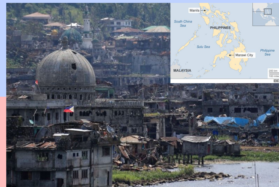
město Marawi v troskách po teroristickém útoku 2017, zdroj: Al-Jazeera