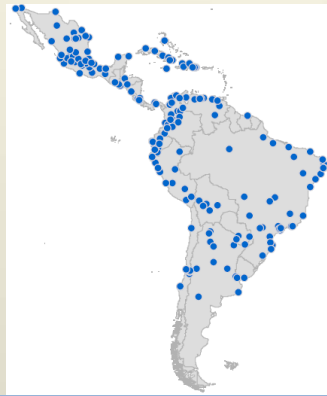
Města LA s více než 200 tisíci obyv.