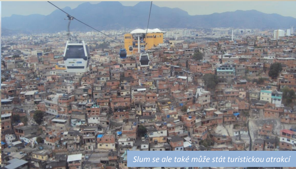
Slum se ale také může stát turistickou atrakcí