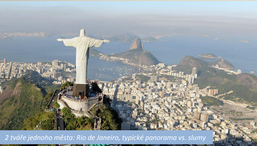
2 tváře jednoho města: Rio de Janeiro, typické panorama vs. slumy